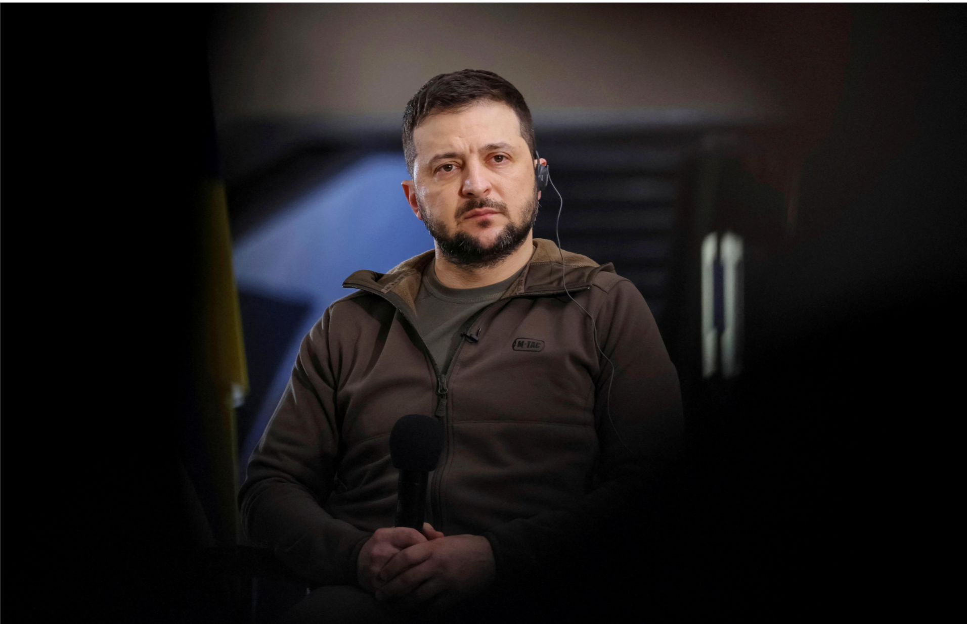
Ukrainan presidentti Volodymyr Zelenskyi tiedotustilaisuudessa Kiovan metrossa.