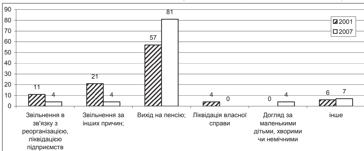
Рис. 2. Причини незайнятості ліквідаторів, 2001 і 2007 роки, %

Для забезпечення адекватної соціальної політики щодо покращення соціально-економічного стану ліквідаторів аварії на ЧАЕС потрібно спрямувати зусилля державних органів влади на вирішення питань щодо належного фінансування всіх Чорнобильських програм, спрямованих на забезпечення соціального захисту постраждалих. Враховуючи реальні можливості державного бюджету, потрібно першочергову увагу зосередити на медичній допомозі ліквідаторам, адже основні соціальні проблеми ліквідаторів прямо або опосередковано пов'язані з погіршенням їх фізичного стану.