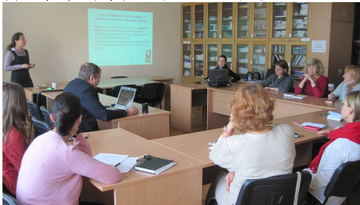
Всеукраїнська конференція 29 жовтня 2015.р